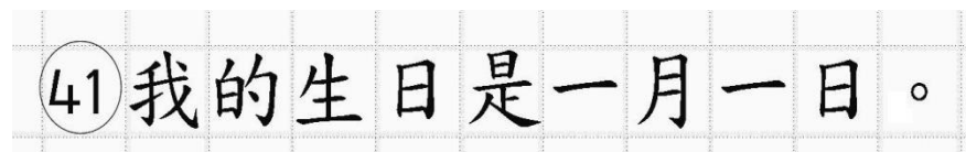
Рис.16. Образец написания иероглифических знаков

Записи в лист 1 и лист 2 бланка ответов № 2 делаются в следующей последовательности: сначала заполняется лист 1, затем заполняется лист 2. Записи делаются строго на лицевой стороне, обратная сторона листов бланка ответов № 2 по китайскому языку НЕ ЗАПОЛНЯЕТСЯ!!!